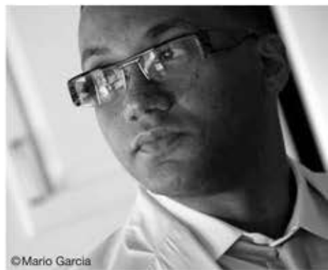
ゴンサロ・ルバルカバ [ピアノ]

1963年、革命後のハバナ生まれ。才能に溢れる。モダンジャズ界を代表するアーティストである。ハバナのインスティテュート・オブ・ファイン・アーツの作曲科を卒業。10代半ばにはジャズ・クラブ等でドラマーやピアニストとしても活躍し、大学卒業後はポピュラー・ミュージシャンの世界へ身を投じる。