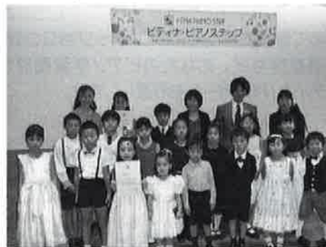
(写真) 前回の豊橋ステップより

《後援》 文部科学省、豊橋市、豊橋市教育委員会、オリエント楽器 《協力》 ピティナ豊橋支部