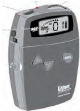
貸出 FM 補聴器▼ (サンプルイメージ)