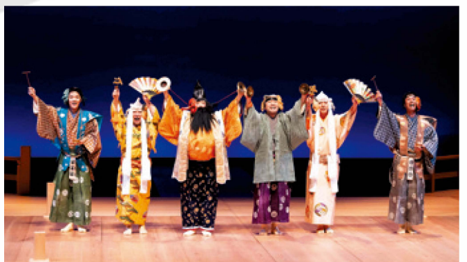
世田谷パブリックシアター「法螺侍」

穂の国とよはし芸術劇場PLAT 〒440-0887 愛知県豊橋市西小田原町123番地 TEL 0532-39-3090 FAX 0532-55-8192 休館日：毎月第3月曜日(祝日の場合は翌平日)