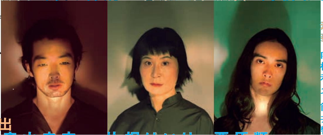
森山未来 片桐はいり 栗原類