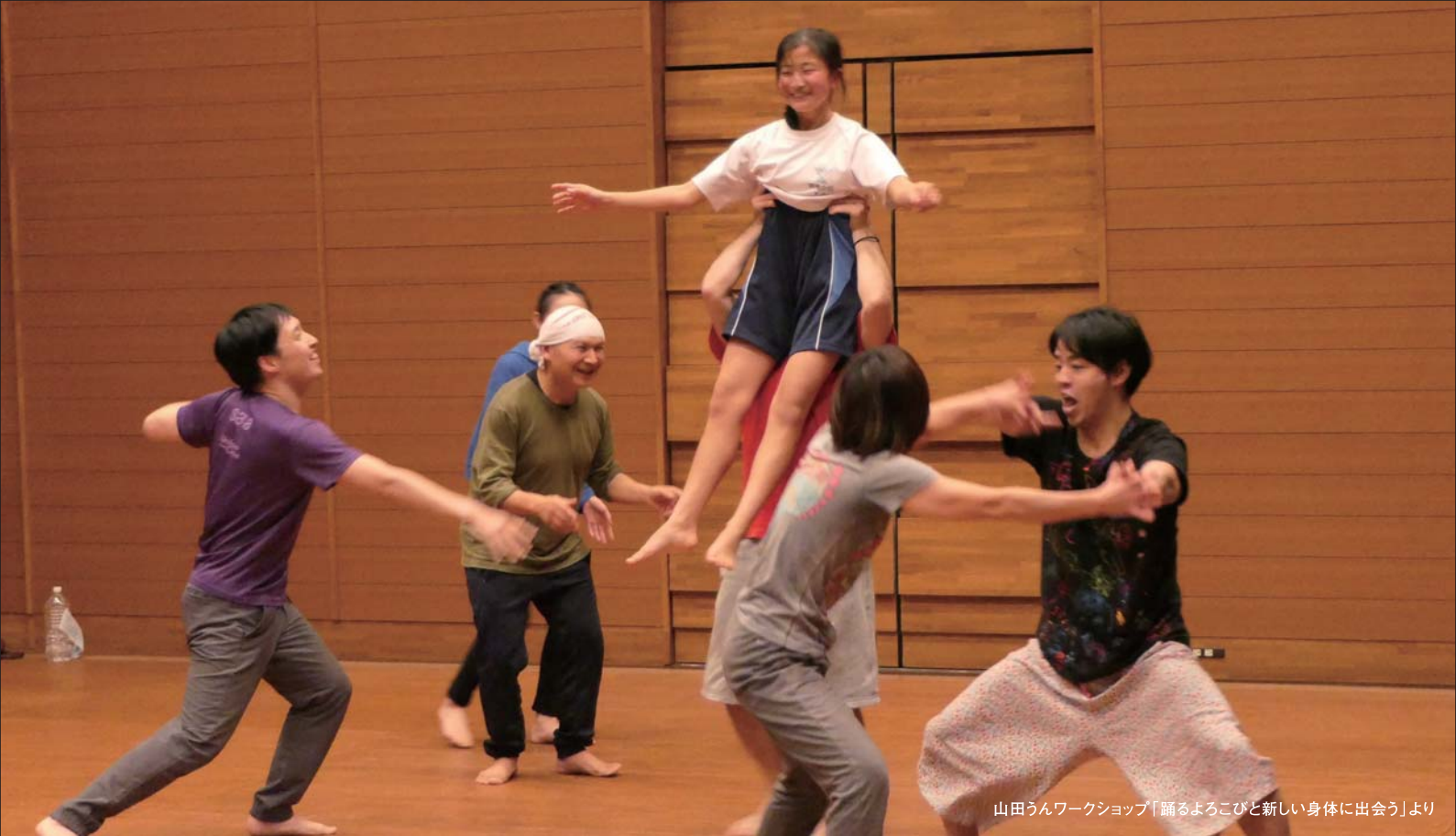
山田うんワークショップ「踊るよこびと新しい身体に出会う」より