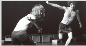
平成29年度公共ホール現代ダンス活性化事業 PLATダンスプログラム

ストラヴィンスキーが1913年に作曲した『春の祭典』 数多くの振付家が挑んできた本作で、鈴木ユキオが新たな時代を切り開く