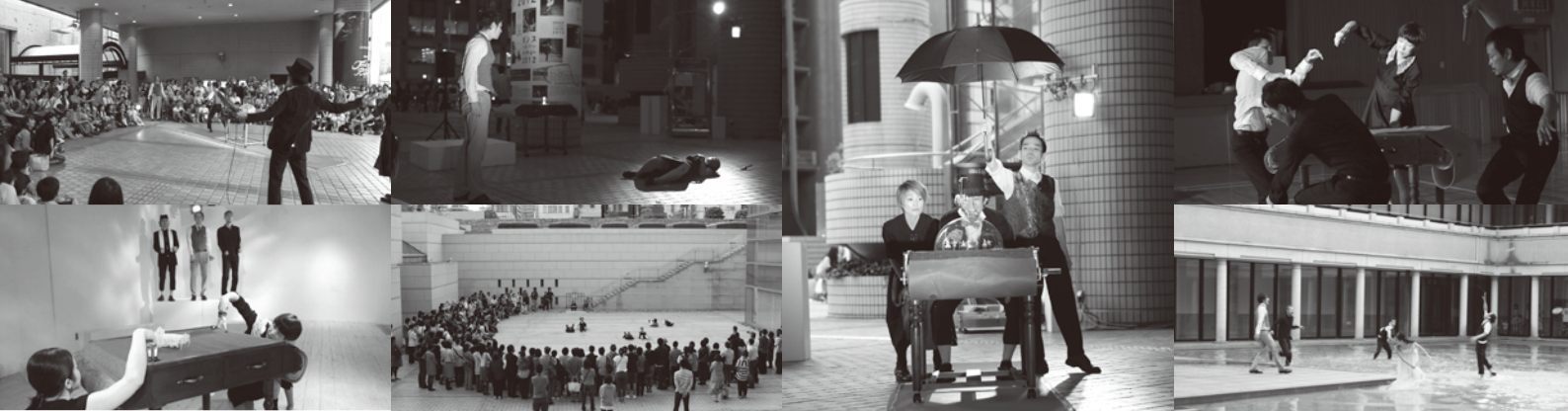
写真は『ロミオとジュリエット』高知県立美術館(初演2011)、世田谷ものづくり学校(2011)、東京都現代美術館(2012)、ダンストリエナーレトーキョー(2012)、岡山県「海の劇場」(2014)から。

イタリアを舞台にしたシェイクスピア悲劇「ロミオとジュリエット」。争いを続ける二つの名家、モンタギュー家とキャピュレット家。それぞれの一人息子と一人娘であるロミオとジュリエットは、出会って一目で恋に落ちてしまった。しかし、二人を巡って様々な事件や行き違いが起こり、やがて二人は大きな決断をする。