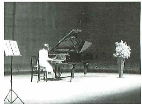
(写真) 前回の豊橋ステップより