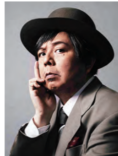
ケラリーノ・サンドロヴィッチ