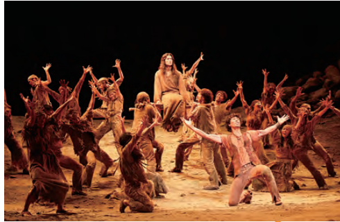
劇団四季「ジーザス・クライスト＝スーパースターエルサレム・バージョン」 「シャンハイムーン」