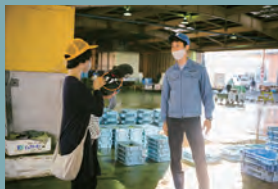
株式会社 豊橋魚市場