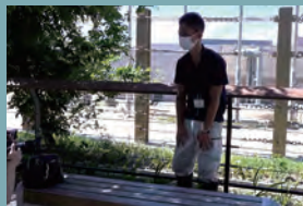
豊橋総合動植物公園 (のんほいパーク)