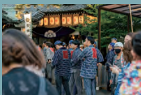
豊橋祇園祭奉賛会