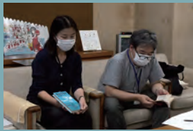
豊橋市中央図書館