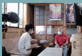
豊橋煙火株式会社