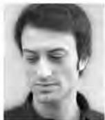
アレッシオ・シルヴェストリン