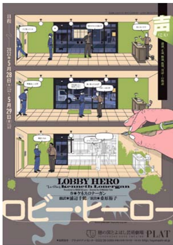
『ロビー・ヒーロー』

ほぼすべての財団主催公演に、若い人にお得な料金を設定しています。 ●料金＝U25[25歳以下]:公演ごとに指定する席種の半額 / 高校生以下:1,000円 ●購入方法＝各公演の一般発売初日から取扱い。●その他＝本人のみ1公演につき1人1枚。枚数限定。座席の指定はできません。要・入場時本人確認書類提示。一部例外あり。詳細は各公演チラシ・HPにて。