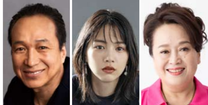
小日向文世 のん 渡辺えり