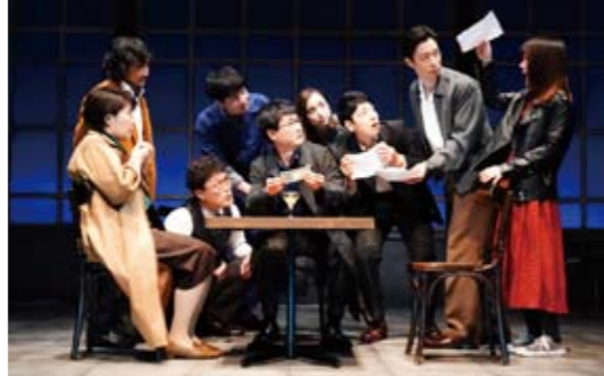
「外の道」舞台写真(2021年)

6/10 [金] 19:00開演 6/11 [土] 14:30開演 PLATダンス・レジデンス 作品集 ●会員先行＝4月16日(土) ●一般＝4月23日(土) ●上演作品＝京極明彦『カイロー』、BATIK『春の祭典』、富士山アネット『Unrelated to You』 ●会場＝PLATアートスペース ●料金＝[全席自由・日時指定・整理番号付き]一般3,500円ほか