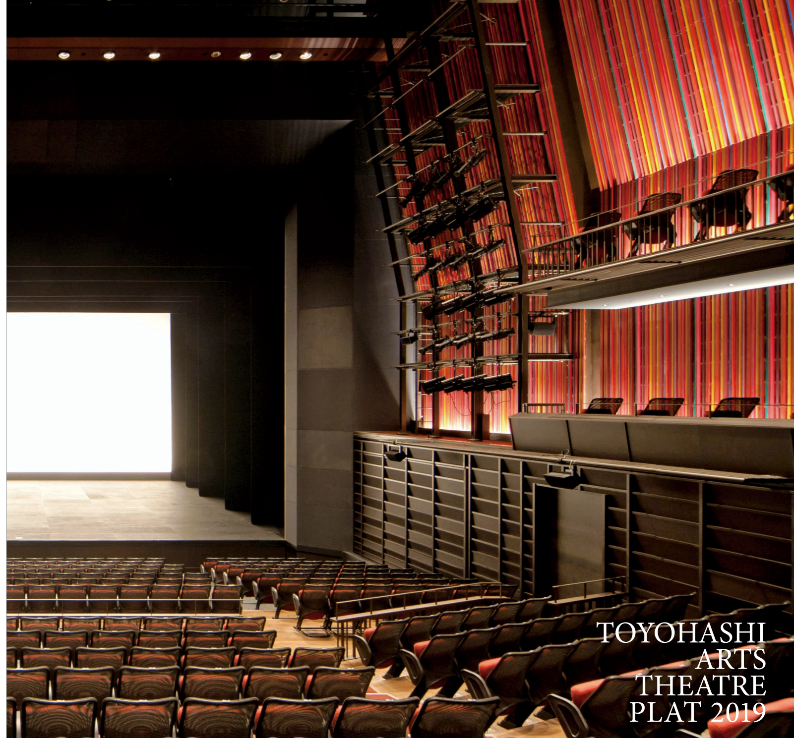
TOYOHASHI ARTS THEATRE PLAT 2019